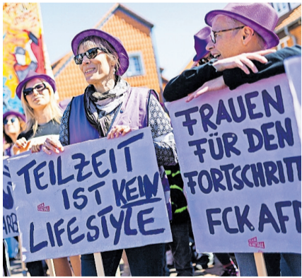
Botschaften zum 1. Mai im niedersächsischen Salzgitter.

München – Bei zahlreichen Kundgebungen in ganz Deutschland haben Gewerkschaften, Verbände und Parteien am Tag der Arbeit für die Rechte und Interessen von Arbeitnehmerinnen und Arbeitnehmern demonstriert. Das Motto des Deutschen Gewerkschaftsbunds für den Tag lautete: „Erst unsere Jobs, dann eure Profite!“ Proteste richteten sich gegen Stellenabbau und das Management von Unternehmen, aber auch gegen die von der Bundesregierung geplanten Einsparungen zur Stabilisierung der Sozialversicherungsbeiträge. Bei der zentralen Kundgebung der Gewerkschaften in Nürnberg kündigte die DGB-Bundesvorsitzende Yasmin Fahimi Widerstand gegen Reformen des Sozialstaats an, welche die Lasten ungerecht verteilen. Man werde „das Bollwerk bleiben gegen Rückfälle in die Anfangszeit des Kapitalismus“, so Fahimi.